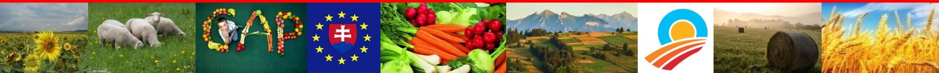
Jozef Bireš zastupujúci minister pôdohospodárstva a rozvoja vidieka